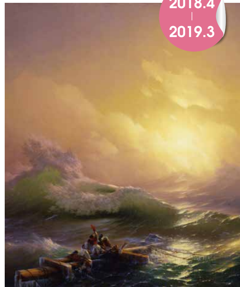
アイヴァソフスキー《第九の怒濤》部分 1850年