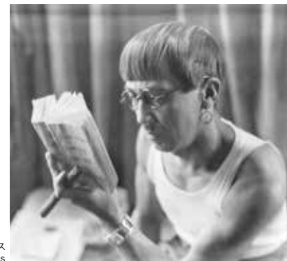
藤田嗣治 1928年頃

フランスで画家としての地位を確立した藤田嗣治 (1886-1968) は、絵画だけでなく本の仕事にも積極的に取り組みました。ヨーロッパでは書物の歴史は古く、芸術作品としての価値も有しています。本展では、フランスで発行された挿絵本、日本での出版に関わる仕事、大型豪華本の挿絵などの「本のしごと」を中心に、絵画や版画、貴重な手紙、オブジェなどもあわせて、藤田の幅広い活躍を紹介します。