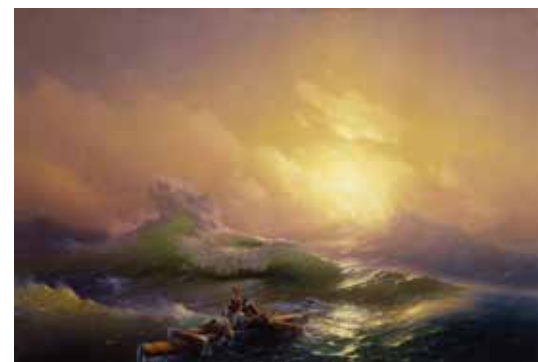
アイヴァゾフスキー《第九の怒濤》1850年 221×332cm 国立ロシア美術館蔵

世界有数のロシア美術コレクションを誇る国立ロシア美術館の収蔵品より、アイヴァゾフスキーの《第九の怒濤》をはじめ、レーピン、ヴァシーリエフ、ペロフ、マコフスキー、シーシキンなど著名な作家の作品約40点を紹介します。本展では、「夢」「希望」「愛」のテーマのもと、多様な表現で描かれたロシアの風景や庶民の生活に焦点を当て、ロシア絵画の深い精神性に迫ります。